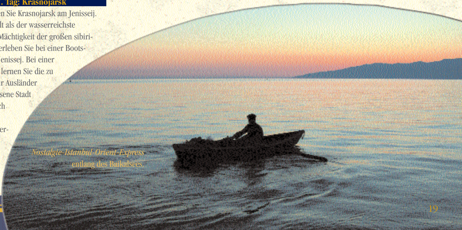
Nostalgie-Istanbul-Orient-Express entlang des Baikalsees.

Heute erwartet Sie der landschaftliche Höhepunkt der Reise. Der Sonderzug bummelt am Vormittag mehrere Stunden lang über eine Nebenstrecke der Transsib unmittelbar am Ufer des Baikalsees entlang. Atemberaubende Ausblicke auf den tiefblauen See und die Berge lassen diese Fahrt zu einem unvergesslichen Erlebnis werden. Der Baikalsee wird die „Perle Sibiriens“ genannt. Mit einer Tiefe von 1.620 m ist der Baikalsee der tiefste See der Welt und enthält das größte Süßwasservorkommen der Erde. Per Bootstransfer gelangen Sie über den Baikalsee zum Dorf Listwjanka. Hier unternehmen Sie einen Rundgang durch das typisch sibirische Holzhäuserdorf und besuchen die reno-